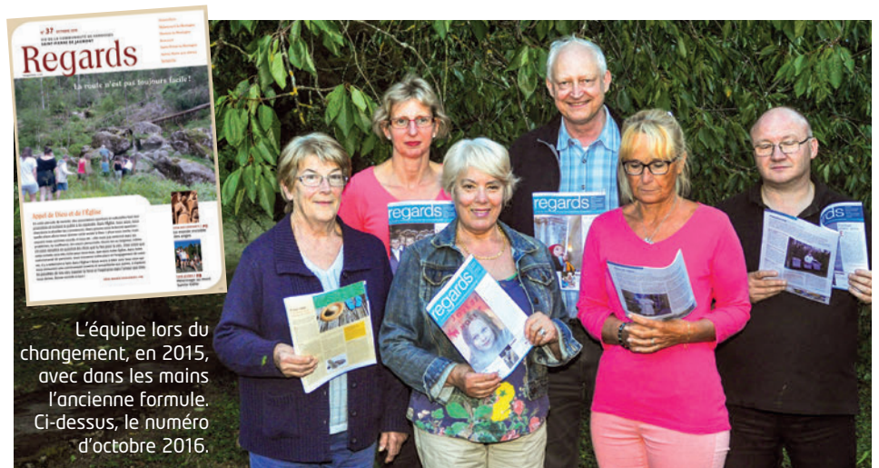
L'équipe lors du changement, en 2015, avec dans les mains l'ancienne formule. Ci-dessus, le numéro d'octobre 2016.