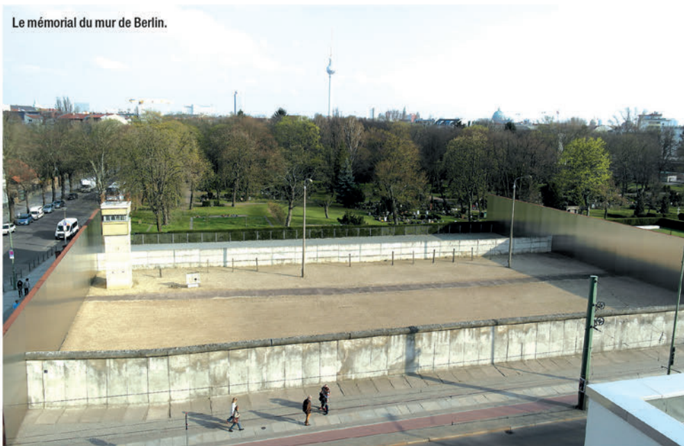
Le mémorial du mur de Berlin.

Hélas, il y a encore des murs de séparation dans le monde. Celui de Berlin, de sinistre mémoire, a heureusement été détruit.