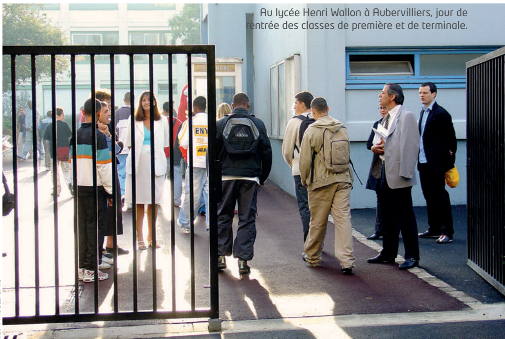
Au lycée Henri Wallon à Rubervilliers, jour de rentrée des classes de première et de terminale.