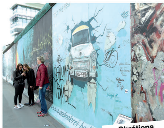
Une portion du mur de Berlin conservée.

L e mur de Berlin a été détruit le 9 novembre 1989, mais il a tenu 28 ans ! À quoi servait-il ? À empêcher les habitants de l'Allemagne de l'Est à fuir vers l'Allemagne de l'Ouest. Quels en furent les résultats ? Un sentiment d'enfermement, de peur, une exacerbation des tensions allant jusqu'à la haine pour certains, au moins 132 personnes y ont perdu la vie... Des pans de ce mur ont été conservés en Mémorial, mais quel message peut-on y lire ?