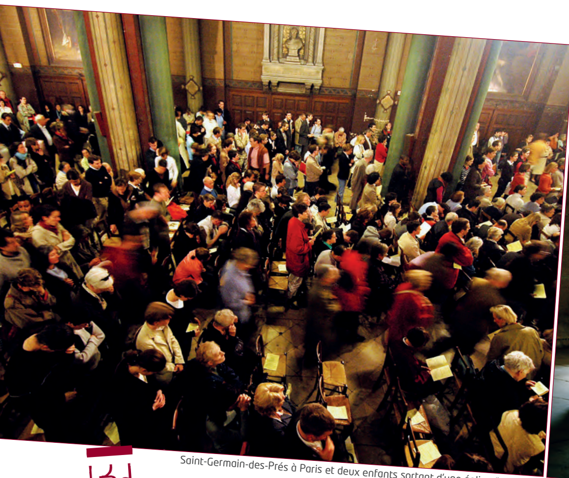
Saint-Germain-des-Prés à Paris et deux enfants sortant d'une église (Vézelay).