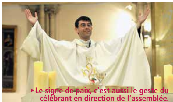
► Le signe de paix, c'est aussi le geste du célébrant en direction de l'assemblée.

La congrégation rappelle d'abord que le geste de paix n'est pas « mécanique » et que le célébrant peut tout à fait se dispenser d'inviter les fidèles à échanger la paix. Plus profondément, la congrégation insiste sur le sens profond du geste de paix par