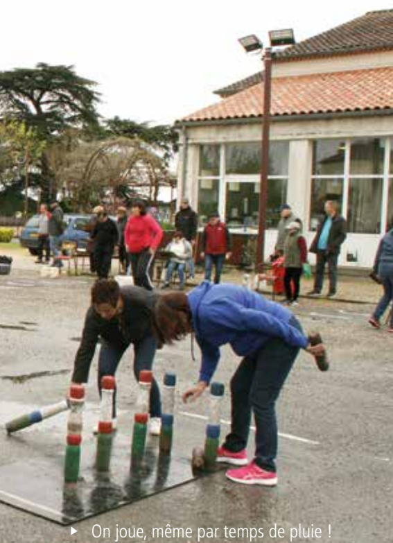
► On joue, même par temps de pluie !

► Pourensavoirplus, une vidéo: https://www.youtube.com/watch?v=uPK_pnv2tAY