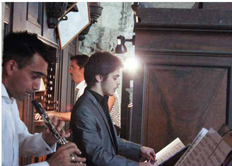
► « La musique est toujours au service de la liturgie et de la foi. »

Enfant, j'ai appris la beauté de la musique classique grâce à maman qui jouait de l'orgue et du piano. Elle joue toujours! Les œuvres de Bach, de Beethoven et de Brahms m'habitaient lorsque j'étais censé faire la sieste.