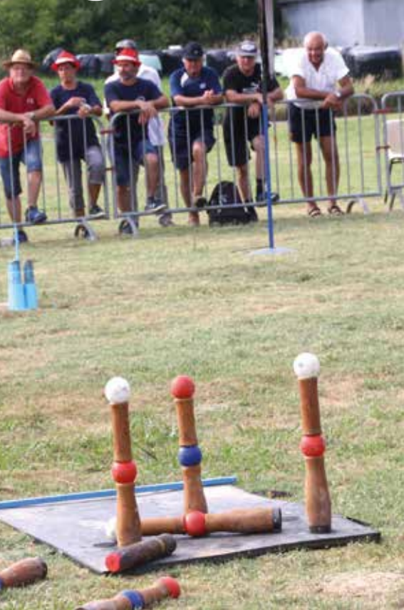
► Des connaisseurs dans l'assistance.