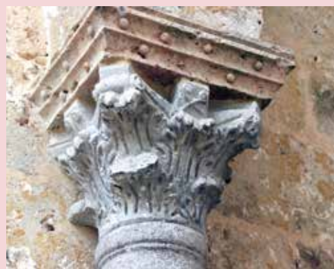
► Un des chapiteaux antiques réemployés à Genens.